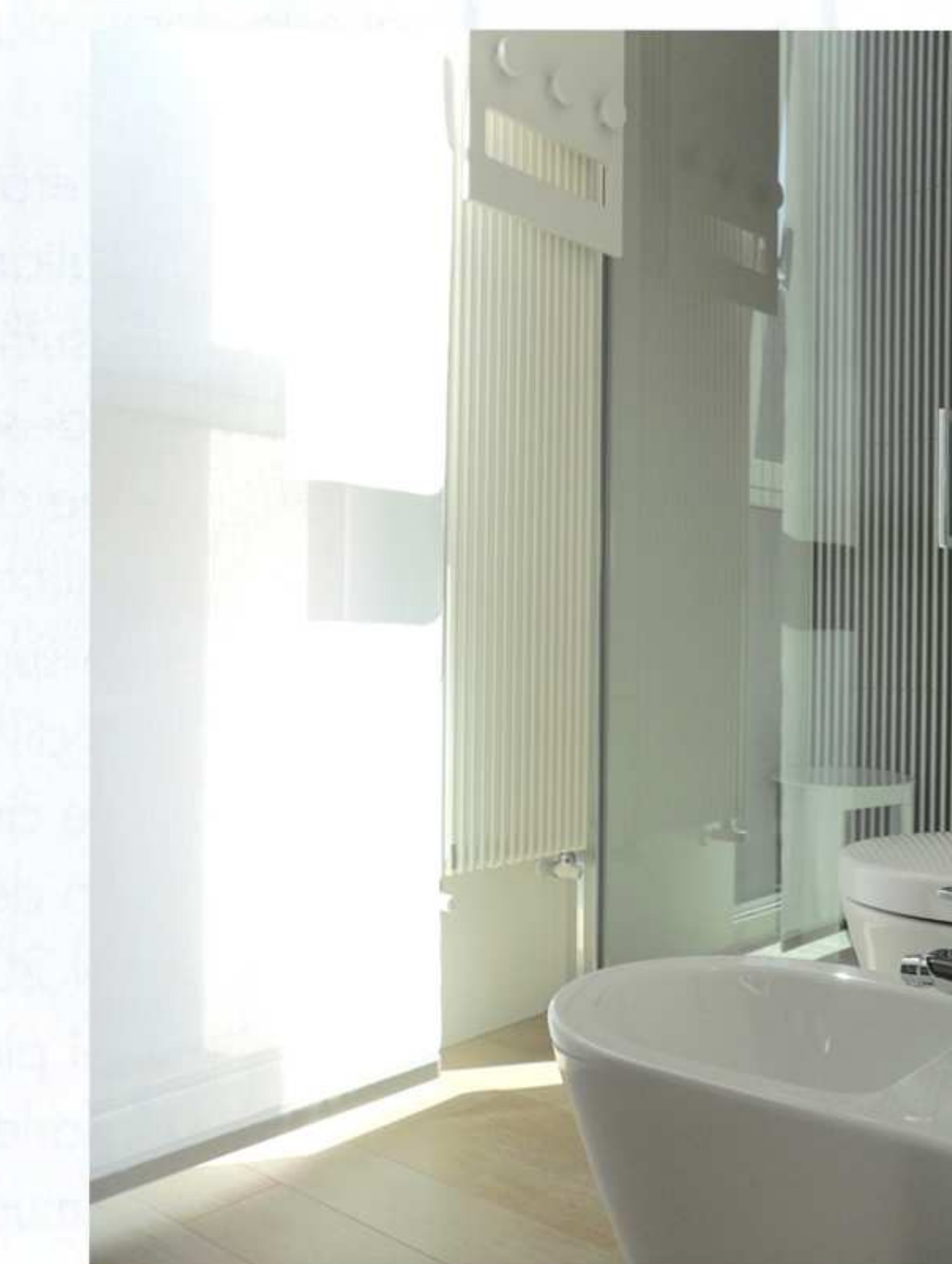
➤ scorcio zona sanitari , maxi tenda a rullo a tutt'altezza sullo sfondo e termoarredo