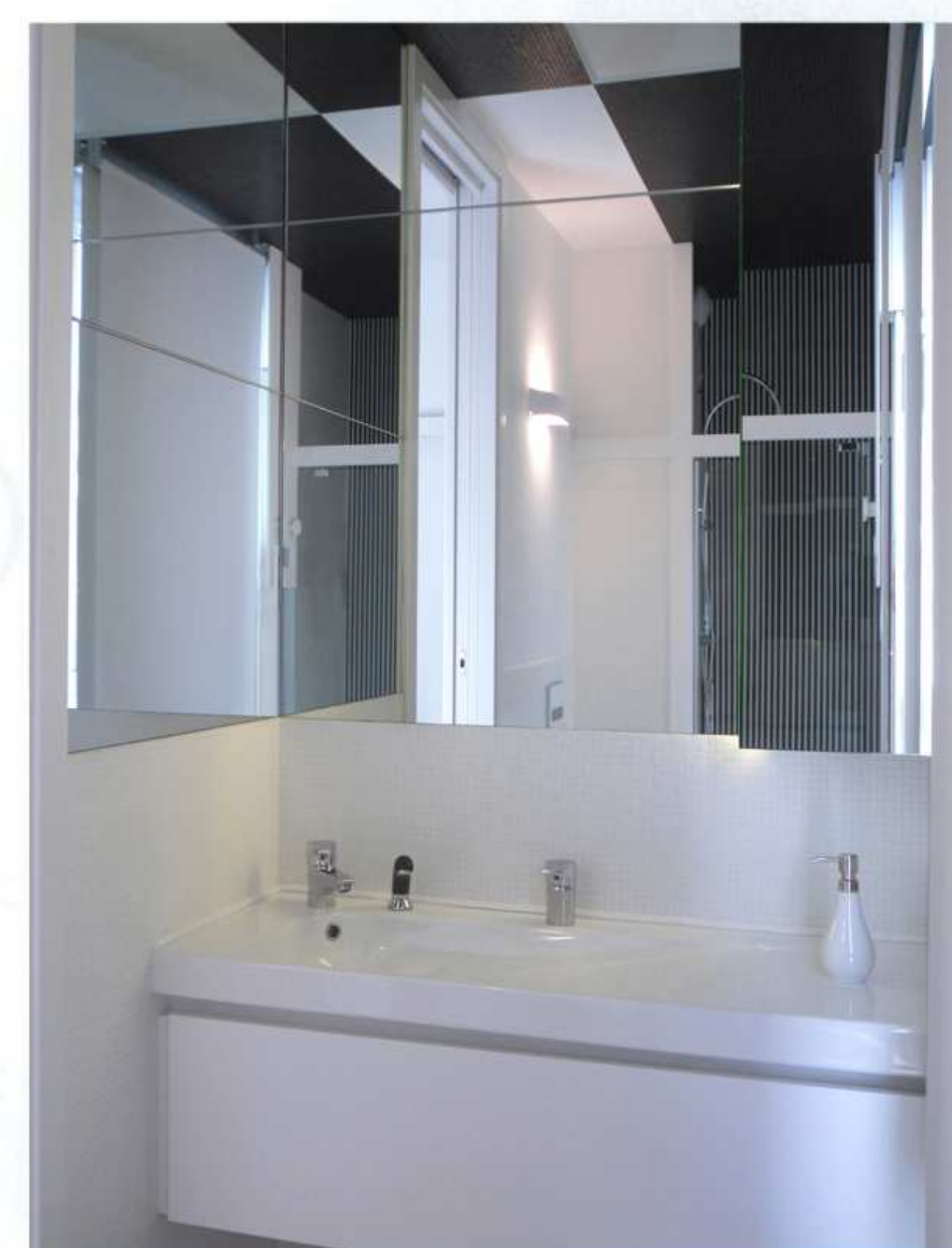
➤ zona lavabo incassata ed integralmente ricoperta di specchi a filo lucido realizzati su progetto e retroilluminati che riflettono i giochi di chiaro-scuro dei rivestimenti e del soffitto