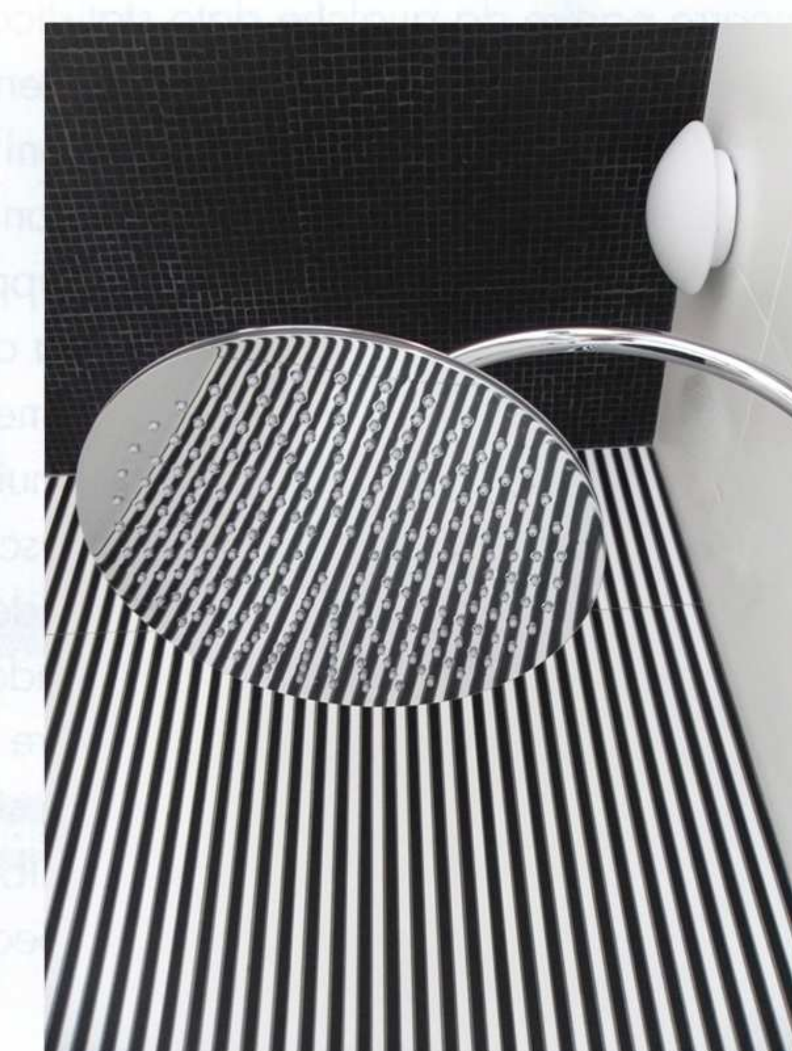
➤ particolare rubinetteria doccia e rivestimento a soffitto in micromosaico e a parete rigato