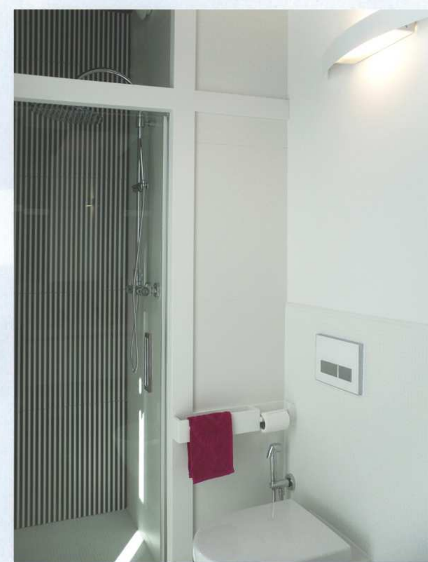
➤ zona doccia ricavata nella nicchia a fianco della parete rivestita in ceramica bianca con sanitari sospesi di piccole dimensioni e particolare illuminazione