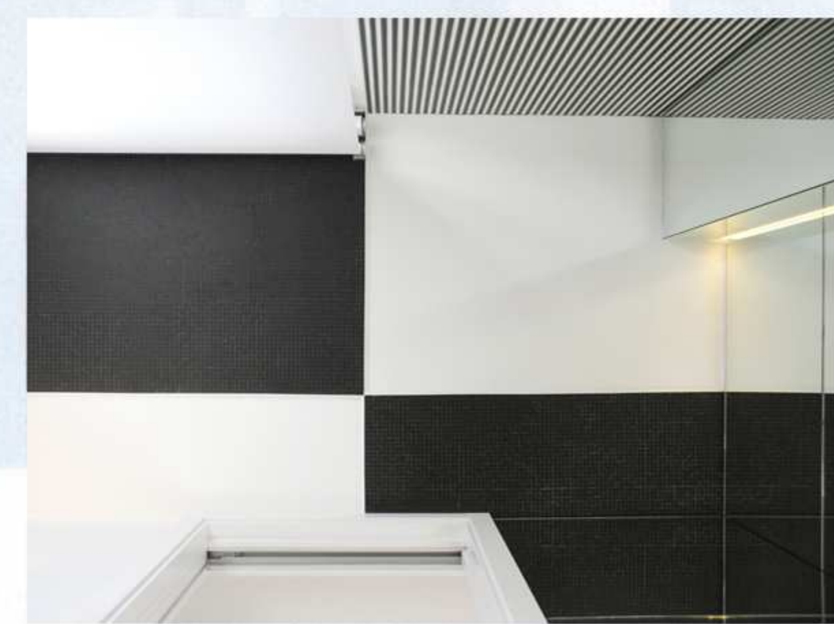
➤ posa rivestimento a soffitto appositamente studiata per creare gioco di luci e chiaro-scuro

essere la luminosità e il design attuale. L'ingresso è immediatamente connotato dalla continuità nell'utilizzo dei materiali attraverso il pavimento che visivamente prosegue sulla parete a fianco. La luce giunge indiretta dalla vetrata sopra alla quinta laterale e dalla grande finestra in fondo al soggiorno.