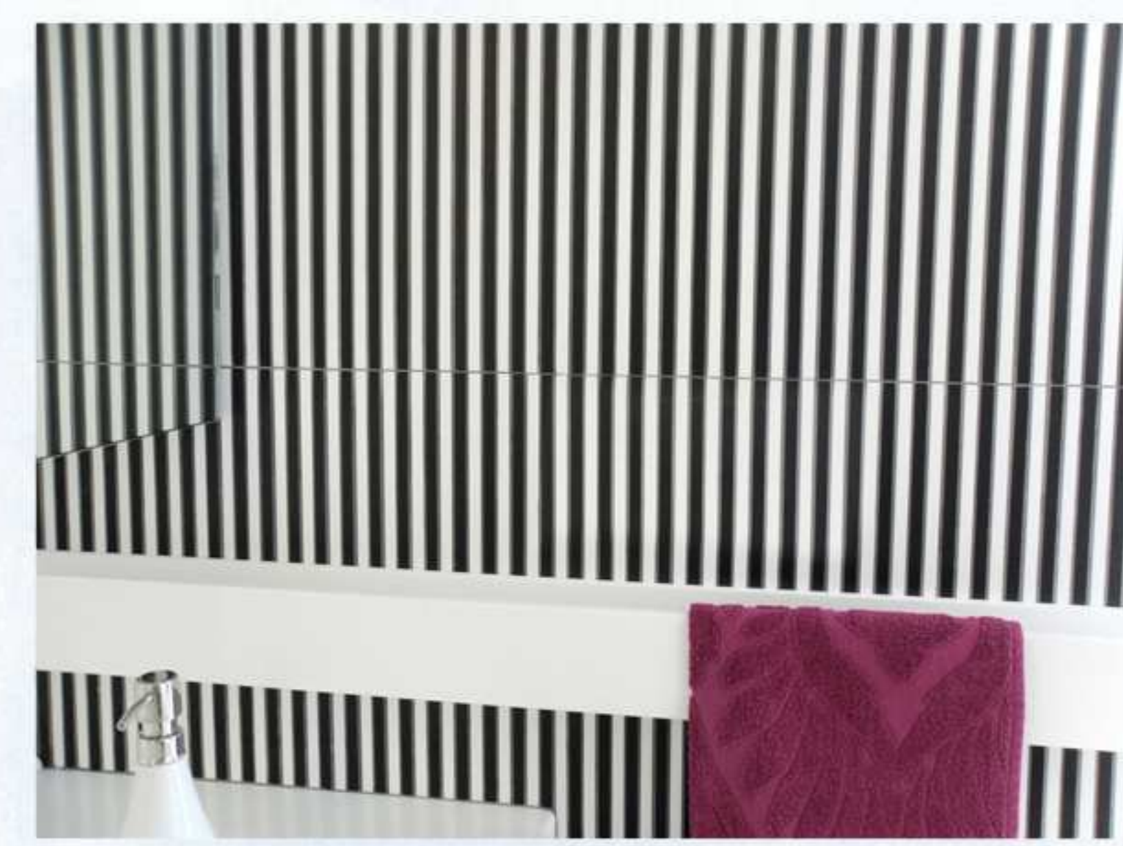
➤ particolare della posa del rivestimento black and white con accessorio realizzato su progetto