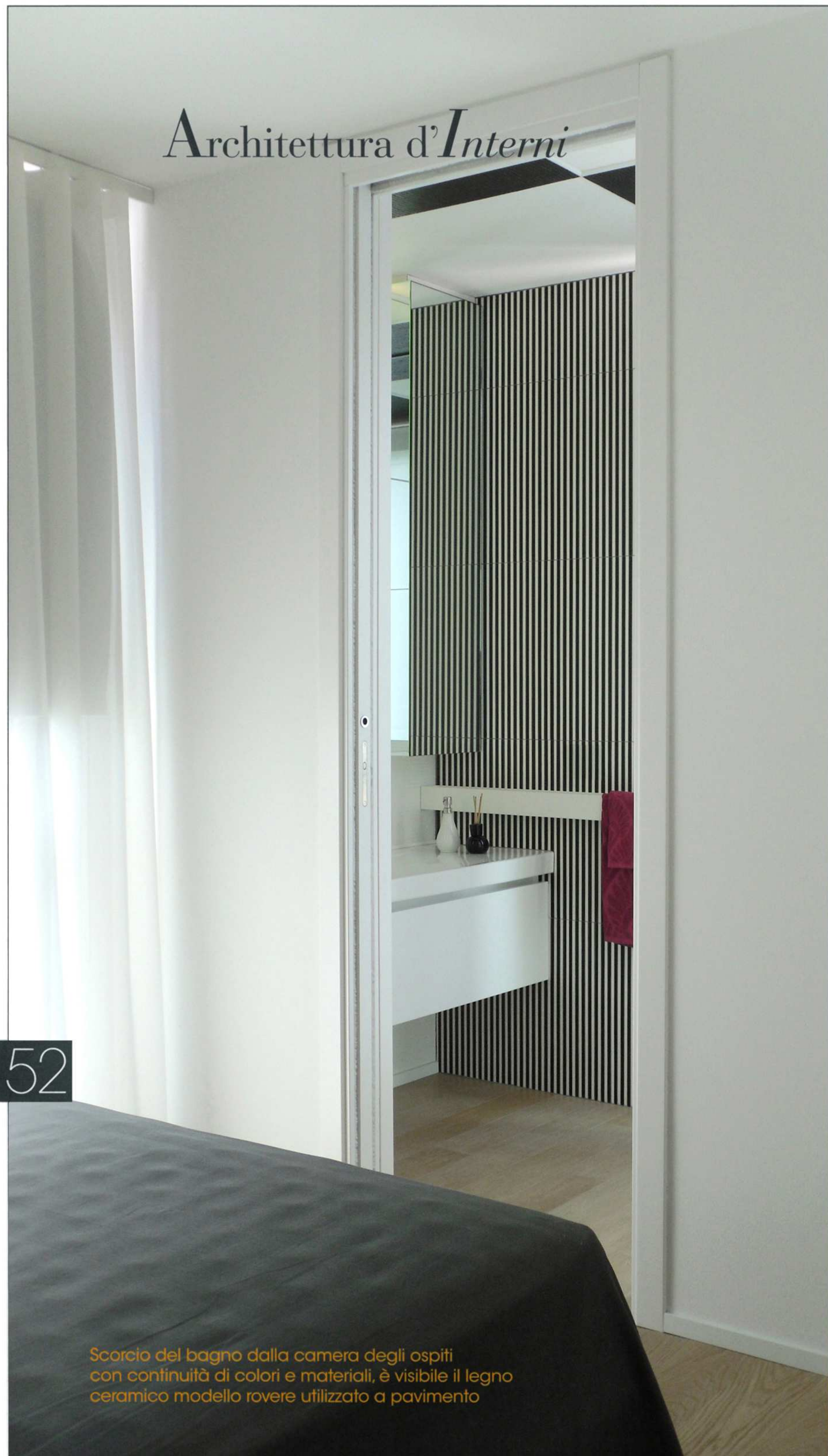
Scorcio del bagno dalla camera degli ospiti con continuità di colori e materiali, è visibile il legno ceramico modello rovere utilizzato a pavimento